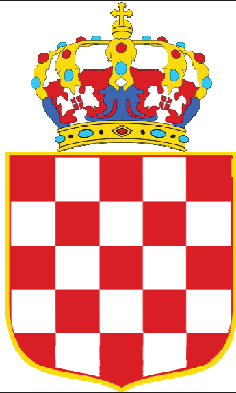
Emblème (version réduite) de la Banovine de Croatie (1940)