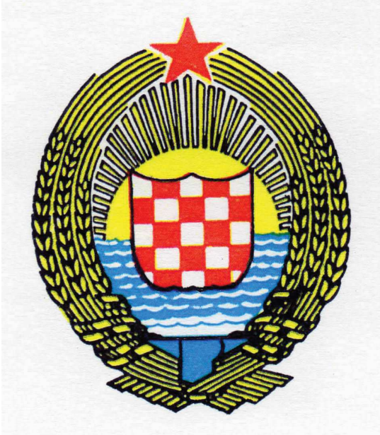
Emblème de la République Socialiste de Croatie (Constitution de la République Socialiste Fédérative de Yougoslavie, Secrétariat à l'information de l'Assemblée fédérale, Beograd 1974)