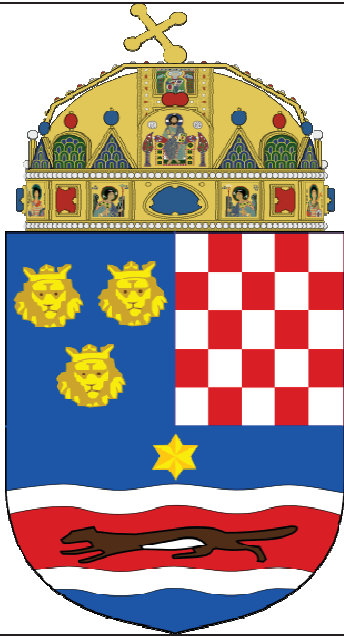
Emblème du Royaume Triunitaire croate ou de Croatie, Dalmatie et Slavonie (jusqu'en 1918)