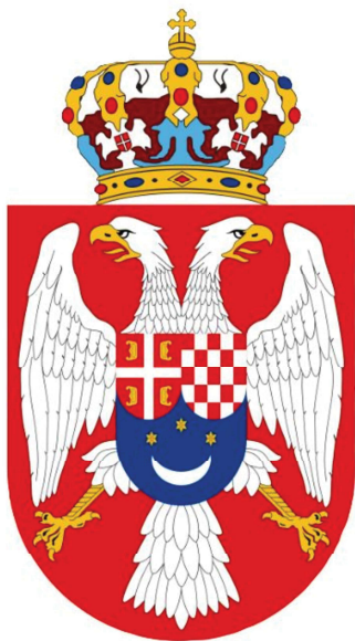
Emblème du Royaume des Serbes, Croates, Slovènes (1921)